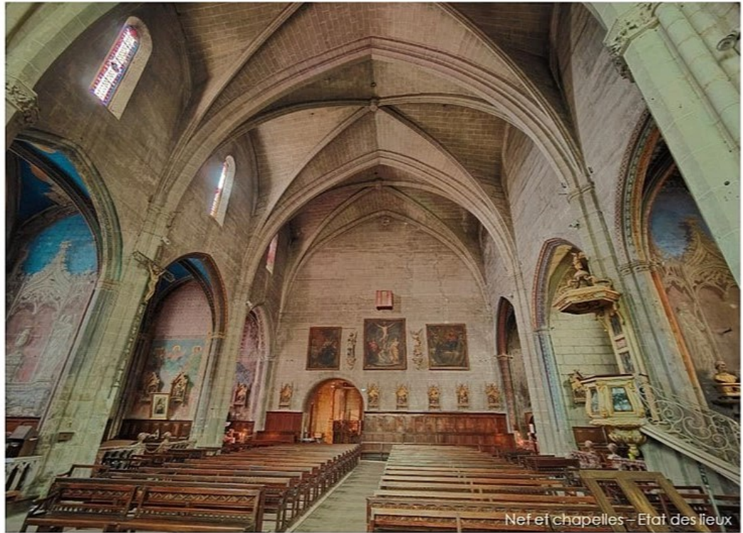
Nef et chapelles – Etat des lieux