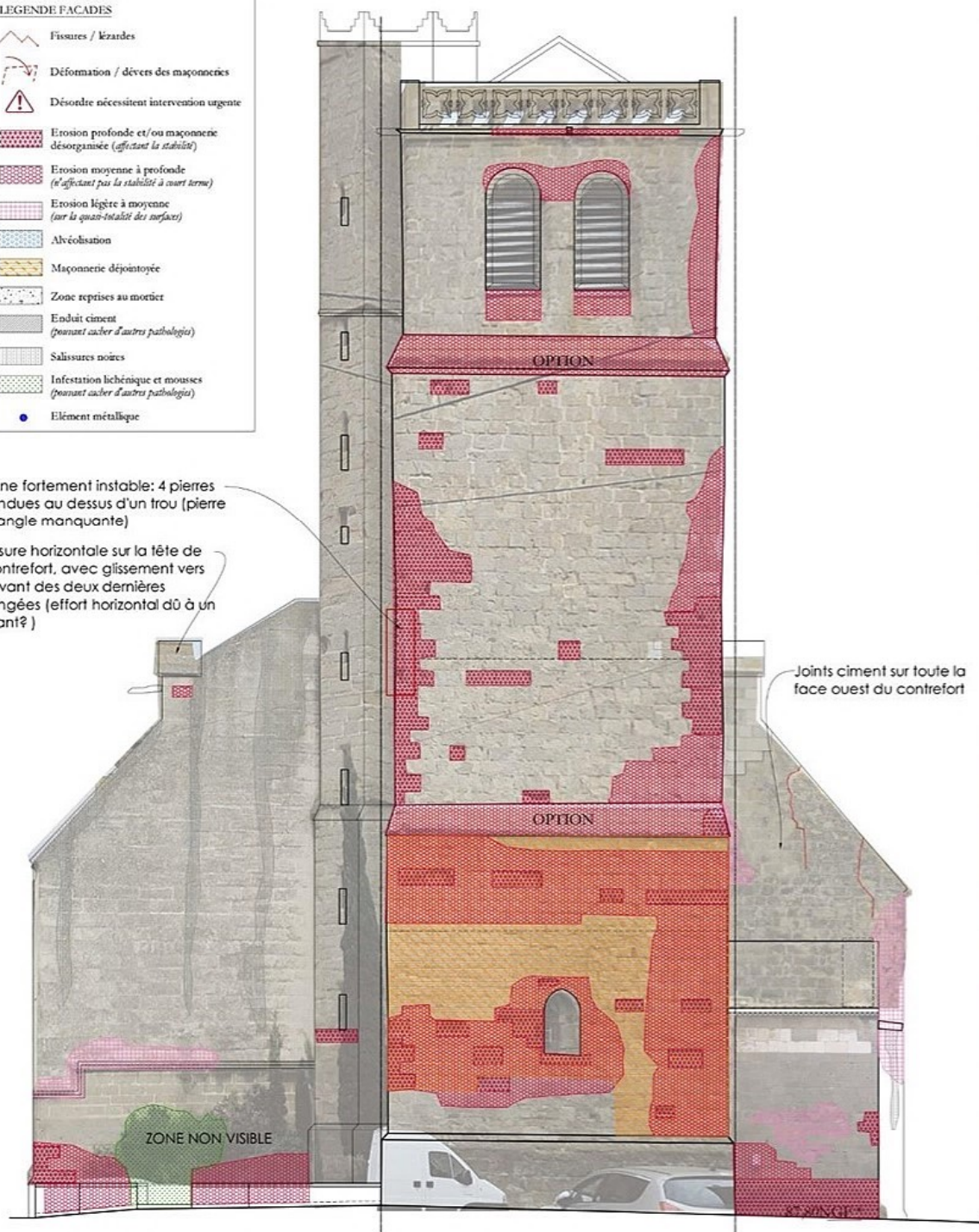
Façade Ouest et clocher – Diagnostic et ortho-photo

Zone fortement instable: 4 pierres fendues au dessus d'un trou (pierre d'angle manquante) Fissure horizontale sur la tête de contrefort, avec glissement vers l'avant des deux dernières rangées (effort horizontal dû à un tirant?)