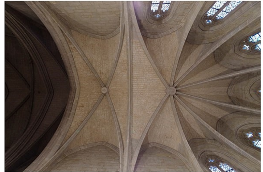
Chœur – Élévations et voutes en pierre de taille