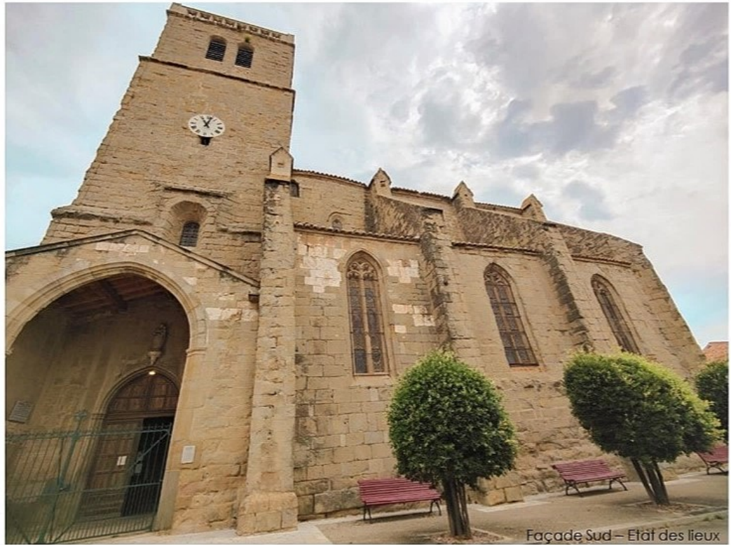
Façade Sud – Etat des lieux