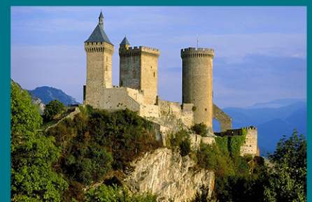
Diagnostic du Château comtal - Foix