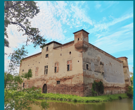
Diagnostic du Château de Candie - Toulouse