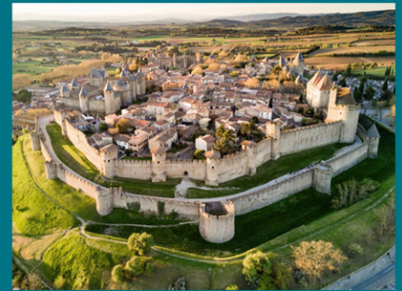
Diagnostic et valorisation de la Cité de Carcassonne