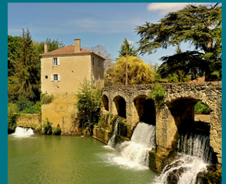
Diagnostic du Pont-barrage et du moulin - Barran