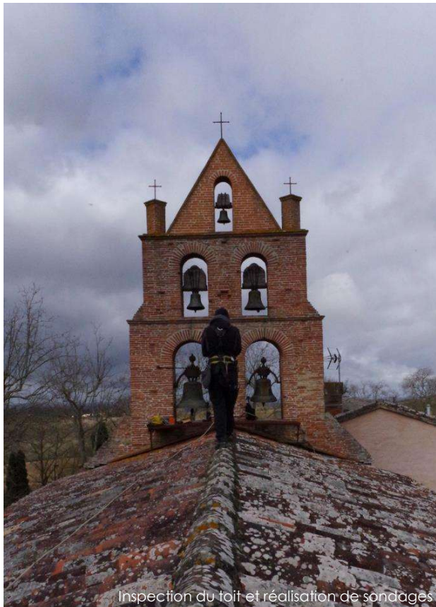
Inspection du toit et réalisation de sondages