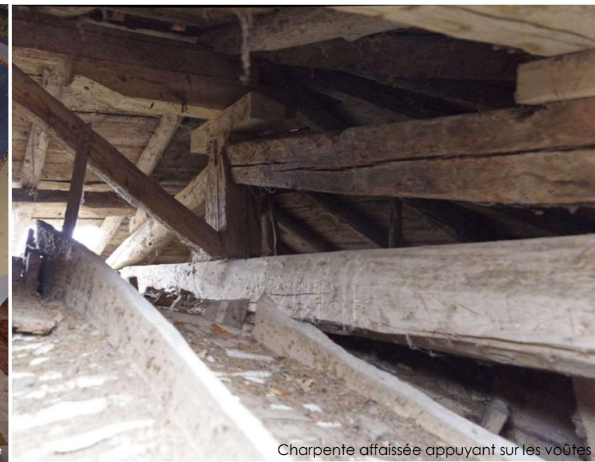
Charpente affaïssée appuyant sur les voûtes