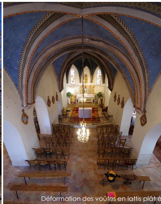
Déformation des voûtes en lattis plâtre