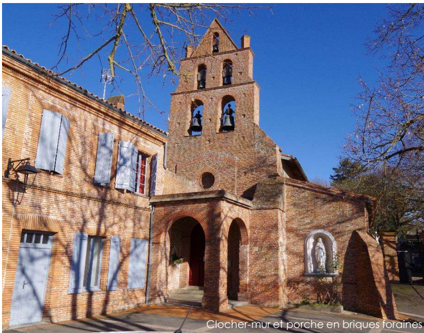
Clocher-mur et porche en briques foraines